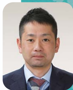
可児夏まつり2016実行委員長