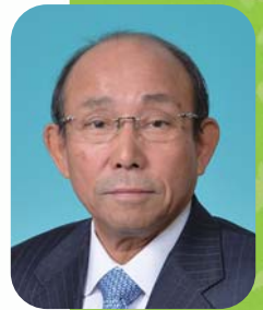
可児商工会議所会頭

最後になりましたが、貴青年部の益々のご発展と部員各位のご健勝を心よりお祈りし、お祝いのことばといたします。