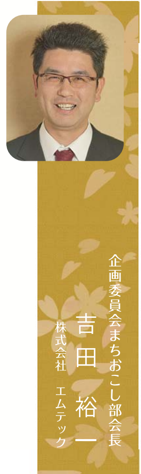
企画委員会まちおこし部会長