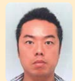
本松 金三 鉄板焼 金三