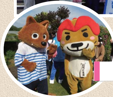
メーテレ ドデスカ! 出演