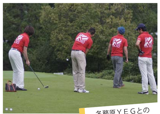
各務原YEGとの 合同例会